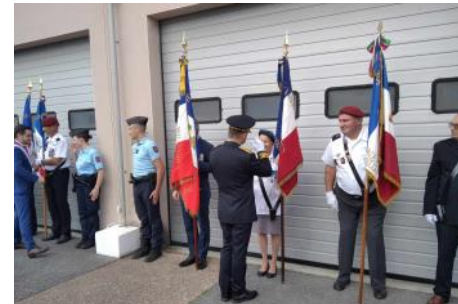
22 septembre prise de commandement compagnie de Limoux