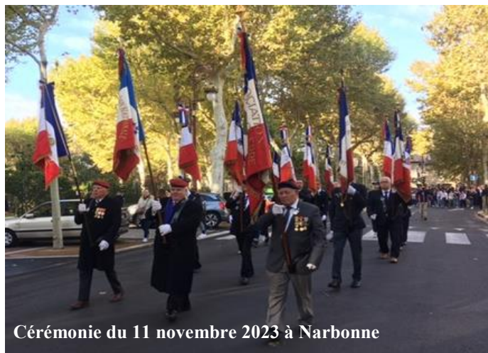
Cérémonie du 11 novembre 2023 à Narbonne