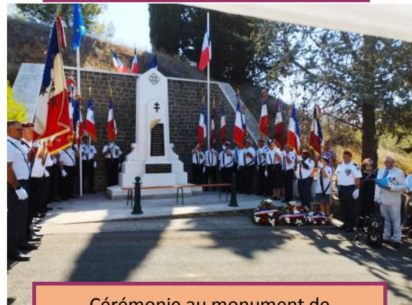
Cérémonie au monument de Rieux-Minervois