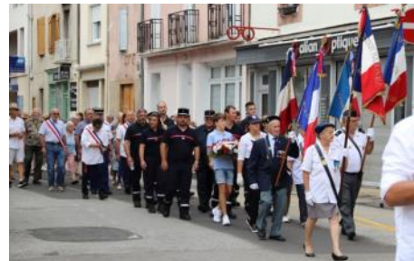
Commémoration de la libération de Quillan