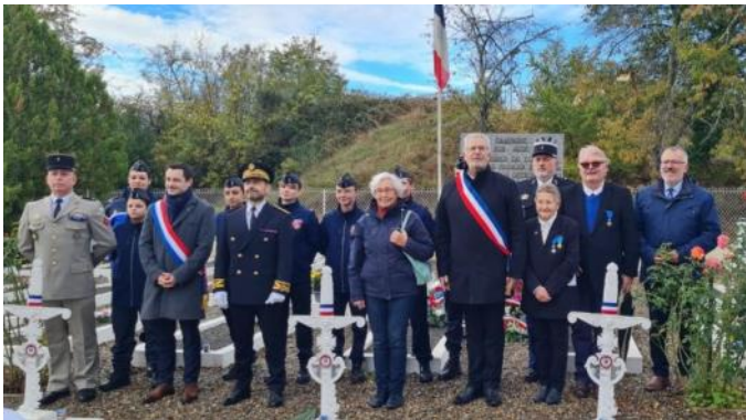
Matinée du souvenir le 4 novembre à Campagne sur Aude