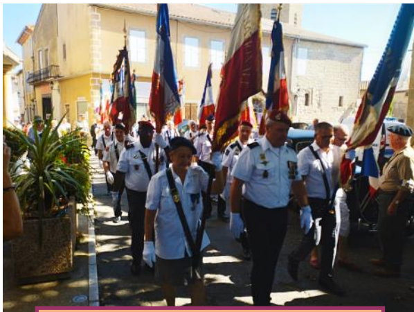
Défilé à Rieux-Minervois