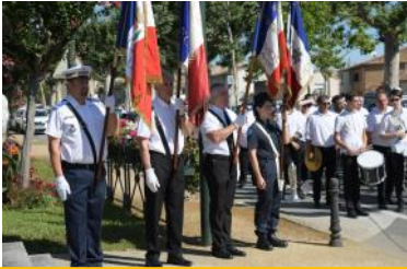
Défilé du 14 juillet